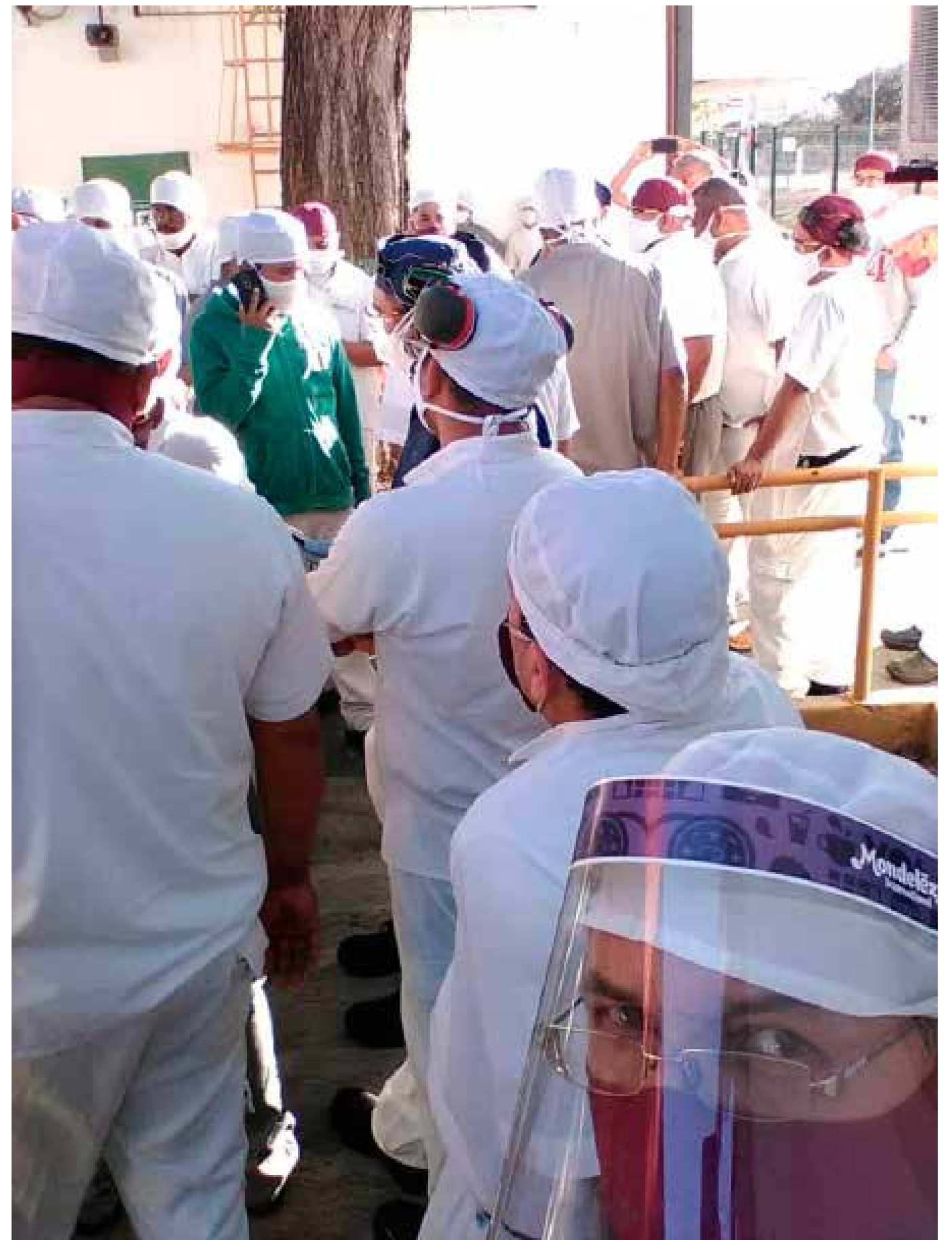
Paro y concentración en la empresa MONDELEZ (anteriormente Alimentos Kraft), por reclamos en mejoras salariales. Barquisimeto, estado Lara.

Así mismo, El hospital José Gregorio Hernández de Puerto Ayacucho en el estado Amazonas se encuentra en un estado calamitoso, sin poder darle atención a los cientos de pacientes indígenas que en más de un 40 % acuden a sus instalaciones, desde puntos recónditos del estado Amazonas y municipio Cedeño, al sur del estado Bolívar e incluso parte del Departamento del Vichada, Colombia.