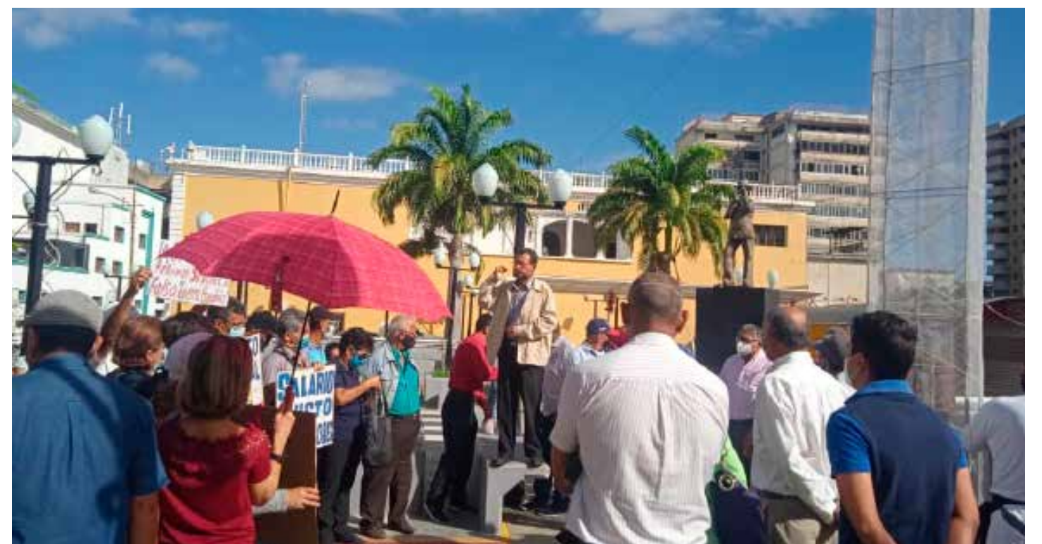
Pancartazo de trabajadores en el estado Lara

Los efectos de una escasez de diésel son mucho más perniciosos que los de la gasolina. Afecta todas las operaciones de los sectores agrícola, ganadero, manufacturero, distribución, además de las plantas eléctricas instaladas por empresas, comercios, clínicas y hospitales por el colapso del sistema eléctrico nacional y las centrales termoeléctricas.