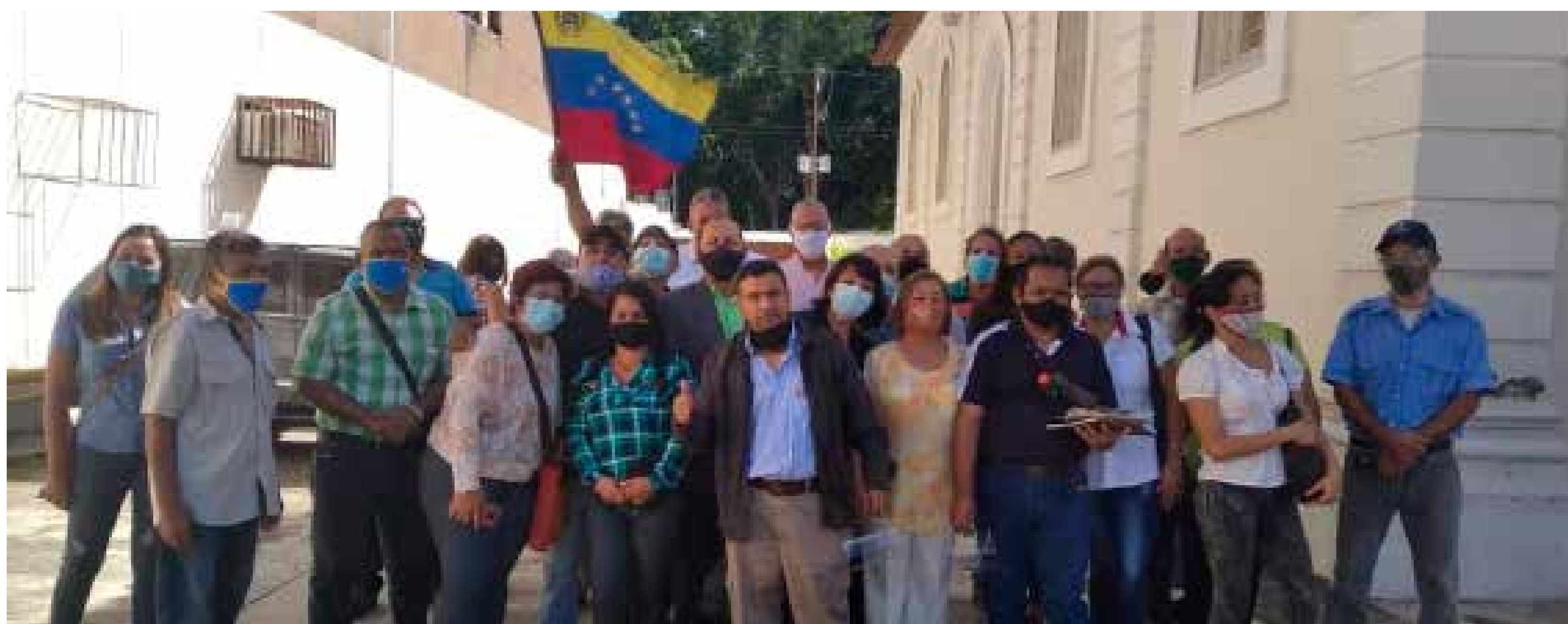
Protesta de la Coalición Sindical de Carabobo por las pésimas condiciones de trabajo y salarios de los educadores

En materia de distribución de combustible, Carlos Odoardo Albornoz, presidente del Instituto Venezolano de la Leche y la Carne (Invelecar), dijo que las zonas agrícolas sólo están recibiendo entre el 12 y el 15% del gasoil que necesitan para labrar la tierra, mover las cosechadoras, los tractores, mantener activas las bombas de riego, ordeñadoras y poder transportar los alimentos hasta la industria o comercios. Rubros como la caña de azúcar, el café y los frijoles que están en plena temporada de cosecha se están viendo afectados por las restricciones de gasoil, más acentuadas en Lara y Zulia, los productores de hortalizas que siembran todo el año registran millonarias pérdidas económicas por no poder trasladar cultivos de tomate, ají, pimentón, cebolla y papas a las ciudades.