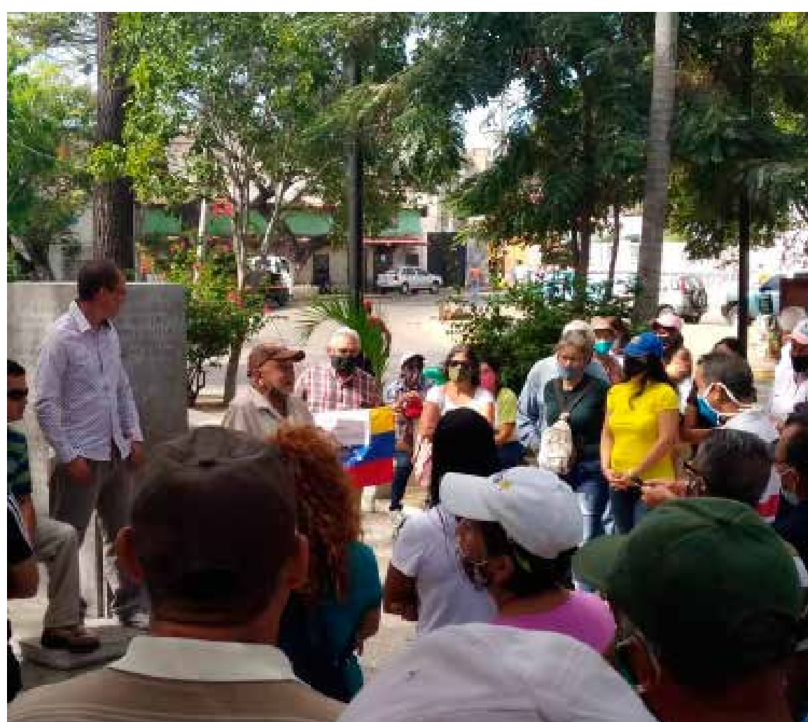
Protesta por condiciones, salarios y ataques a la libertad en el estado Sucre